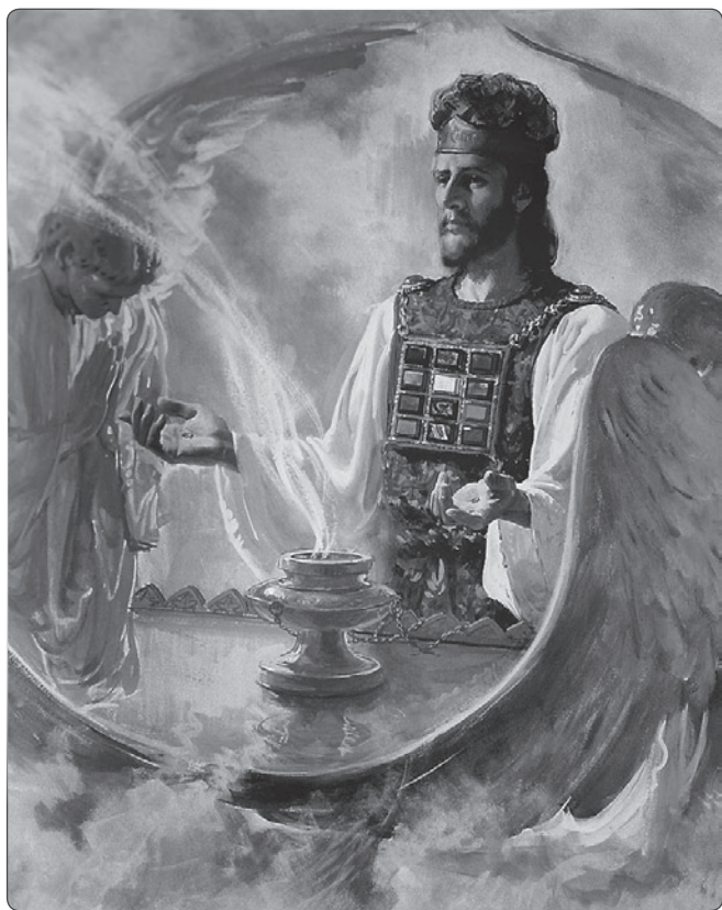
Christi Dienst im himmlischen Heiligtum

menschlichen oder satanischen Kräften zu. Andere hielten daran fest, dass der Herr sie in ihrer vergangenen Erfahrung geführt habe. Weil sie warteten, wachten und beteten, um den Willen des Herrn zu erfahren, sahen sie, dass ihr großer Hohepriester einen andern Dienst begonnen hatte. Als sie ihm im Glauben folgten, verstanden sie auch das Abschlusswerk der Gemeinde. Die erste und zweite Engelsbotschaft wurde ihnen klarer, und sie waren vorbereitet, die feierliche Warnung des dritten Engels aus Offenbarung 14 zu empfangen und der Welt zu verkündigen.